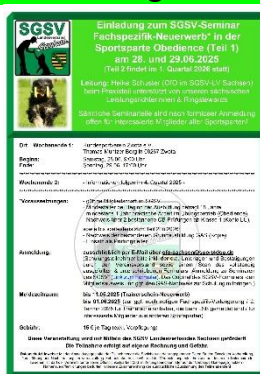
Trainerschein-Neuerwerb Teil 1 (Obedience) am 28./29.06.