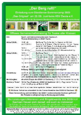
Sommerscamp am 28./29.06. (Offenes Gemeinschaftstraining)

In der Terminfindung sind derzeit noch zwei Praxistrainingstage für „Einsteiger“ (Beginner-Klasse, Klasse 1).