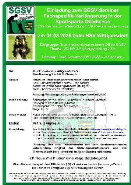
Trainerschein-Verlängerung am 01.03.

Die ersten Ausschreibungen für Obedience-Veranstaltungen in Sachsen sind bereits veröffentlicht, daher füge ich euch neben den „offiziellen“ Einladungen wieder den bereits interaktiven „Terminkalender“ bei (mit „STRG+Klick“ auf die Bilder kommt ihr immer direkt zu den Veröffentlichungen der Ausschreibungen auf der Homepage unseres Landesverbandes).