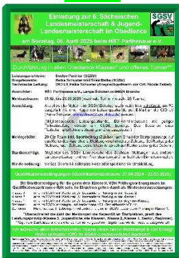
Landesmeisterschaft Obedience LM im LV Sachsen am 06.04.