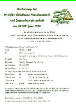
19. SGSV Obedience Meisterschaft am 07./08.06.