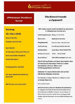
Obedience-Prüfung beim HSV 6-Pfoten Team am 23.03.