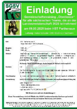
Vorbereitungs-Training für die LM im LV Sachsen am 09.03.