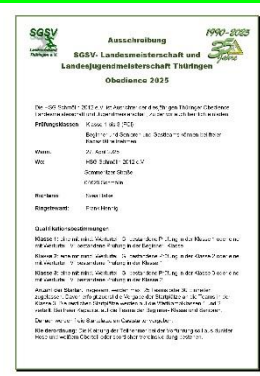
Landesmeisterschaft Obedience LM im LV Thüringen am 27.04.